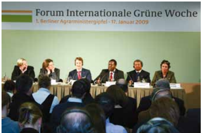
Pressekonferenz zum Berliner Agrarministertag 2009