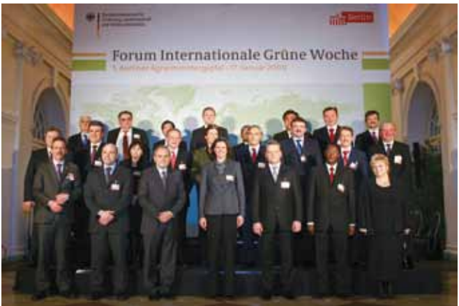
Teilnehmer des Berliner Agrarministertags 2009

Am 16. Januar 2010 veranstaltet das Bundesministerium für Ernährung, Landwirtschaft und Verbraucherschutz (BMELV) den 2. Berliner Agrarministertag. Das Thema des Gipfels lautet „Landwirtschaft und Klimawandel – neue Konzepte von Politik und Wirtschaft“. Mit diesem Thema knüpft das BMELV an den Schwerpunkt des Jahres 2009 „Ernährungssicherung“ an und greift die Herausforderungen des Klimawandels für die Landwirtschaft, insbesondere vor dem Hintergrund der UN-Klimakonferenz im Dezember in Kopenhagen, auf. Agrarministerinnen und Agrarminister aus aller Welt sind an diesem Tag nach Berlin eingeladen, um Erfahrungen und Konzepte zu Klimaschutz und Anpassungsstrategien ihrer Länder zu diskutieren.